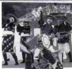
舞台上で熟演する保存会の人たち