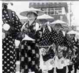
舞台へ向かう出演者