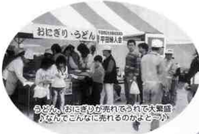
うどん、おにぎりが売れどうれで大賑わい、がなんでこんなに売れるのかよどつとが