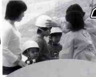
重ダンプに試乗するにはヘルメット着用! 安全第一です。