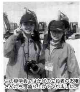
この見学会ではかけの立役者のお嬢さんたち、盛り上げてくれました。