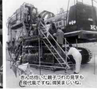
赤ん坊抱いた親子づれの見学も現代風ですね。微笑ましいね。