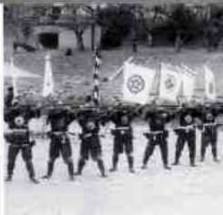
岩国鉄砲隊もイベントに参加