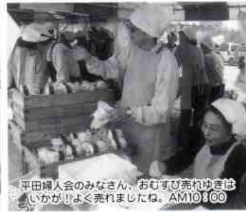
平田婦人会のみなさん、おむすび売れゆきは、いかが!よく売れましたね。AM10:00