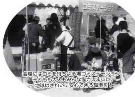
会場にはゴミを持ちまらぬゴミステーション。子どもも大人もみんな協力しました。地球はきれいに安心できる環境を!