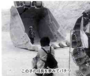
この子の成長を夢みてパチリ