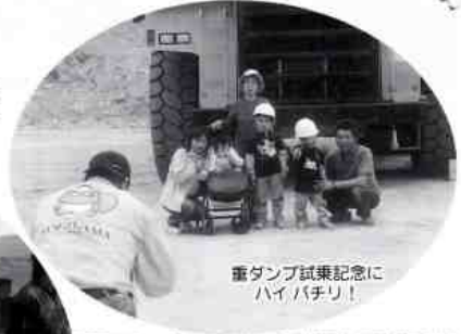
重ダンプ試乗記念にハイパチリ!