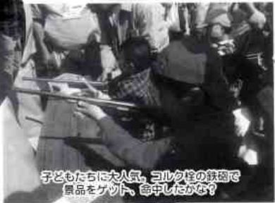
子どもたちに大人気、コルク栓の鉄筒で製品をゲット、命中したかな?