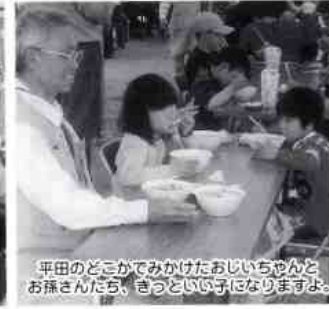
平田のどこかでみかけたおしいちやんとお孫さんたち、きつといい子になりますよ。