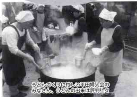
うどんづくりに忙しい平田婦人会のみなさん、うどんの出来は評判止ま