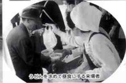
うどんを求めて昼食にする来場者