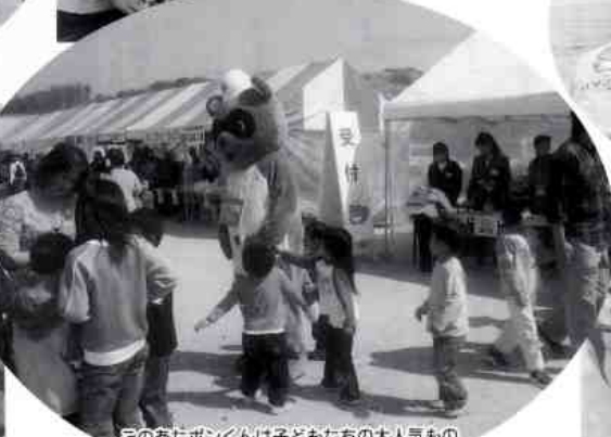
このあたポンくんは子どもたちの大人気もの