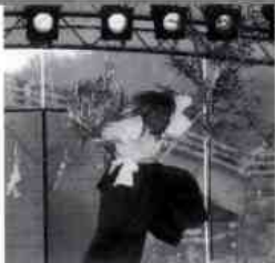
行波の神舞も出演しました